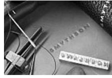
Smythson of Bond Street: la exquisita marroquinería británica