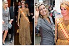
La delgadez de Máxima de Holanda, camino de convertirse en (El Mundo.es)