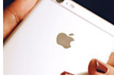
Las tiendas no quieren que descubras este curioso truco para (Rinconred)