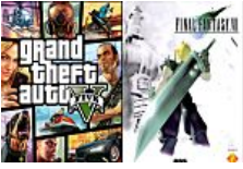
Los videojuegos más caros de la historia