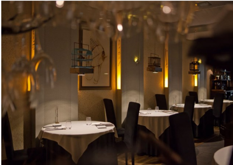
Restaurante Manairó.