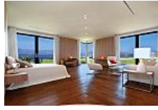
El mercado de las viviendas de lujo crece a la velocidad de la luz