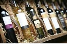
Los mejores vinos para regalar (Guía Repsol)