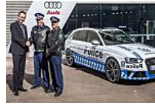
Así es el Audi RS4 de la policía australiana